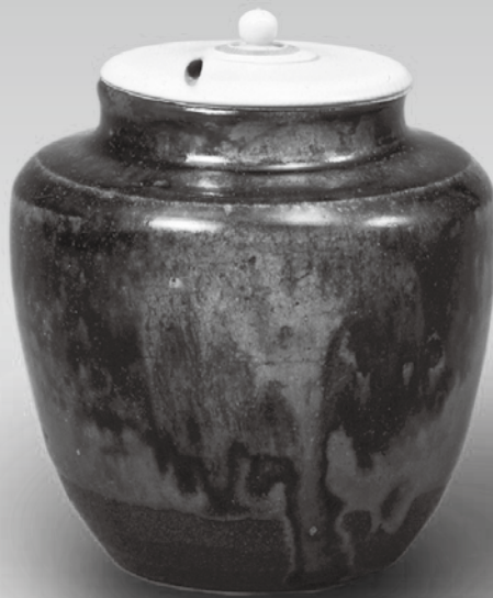
瀬戸面取手茶入 佐久間面取