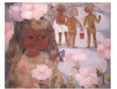
いわさきちひろ《ハマヒルガオと少女》1950年代中頃 ちひろ美術館蔵

会期: 7月14日(土)~9月9日(日) 開館時間: 10:00~18:00 (会期中の金曜日は20:00まで)