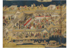
江戸名所図屏風(左隻部分) 江戸時代 重要文化財 出光美術館蔵

会期: 7月28日(土)~9月9日(日) 開館時間: 10:00~17:00 (会期中の金曜日は19:00まで)