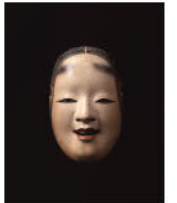
雪の小面 龍右衛門作 金剛家蔵

会期: 6月30日(土)~9月2日(日) 開館時間: 10:00~17:00 (会期中の金曜日は19:00まで)