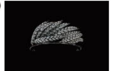
フランソワ・レニエール・ニト《麦の穂のティアラ》1810・11年頃 ゴールド、シルバー、ダイヤモンド ショーメ・コレクション、パリ

会期: 6月28日(土)~9月17日(月・祝) 開館時間: 10:00~18:00 (会期中の金曜日は21:00まで)